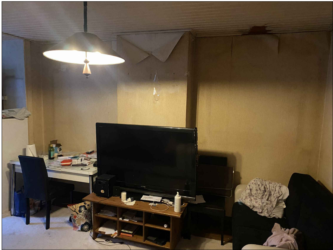
Photo Rez-de-chaussée Salon vers façade arrière