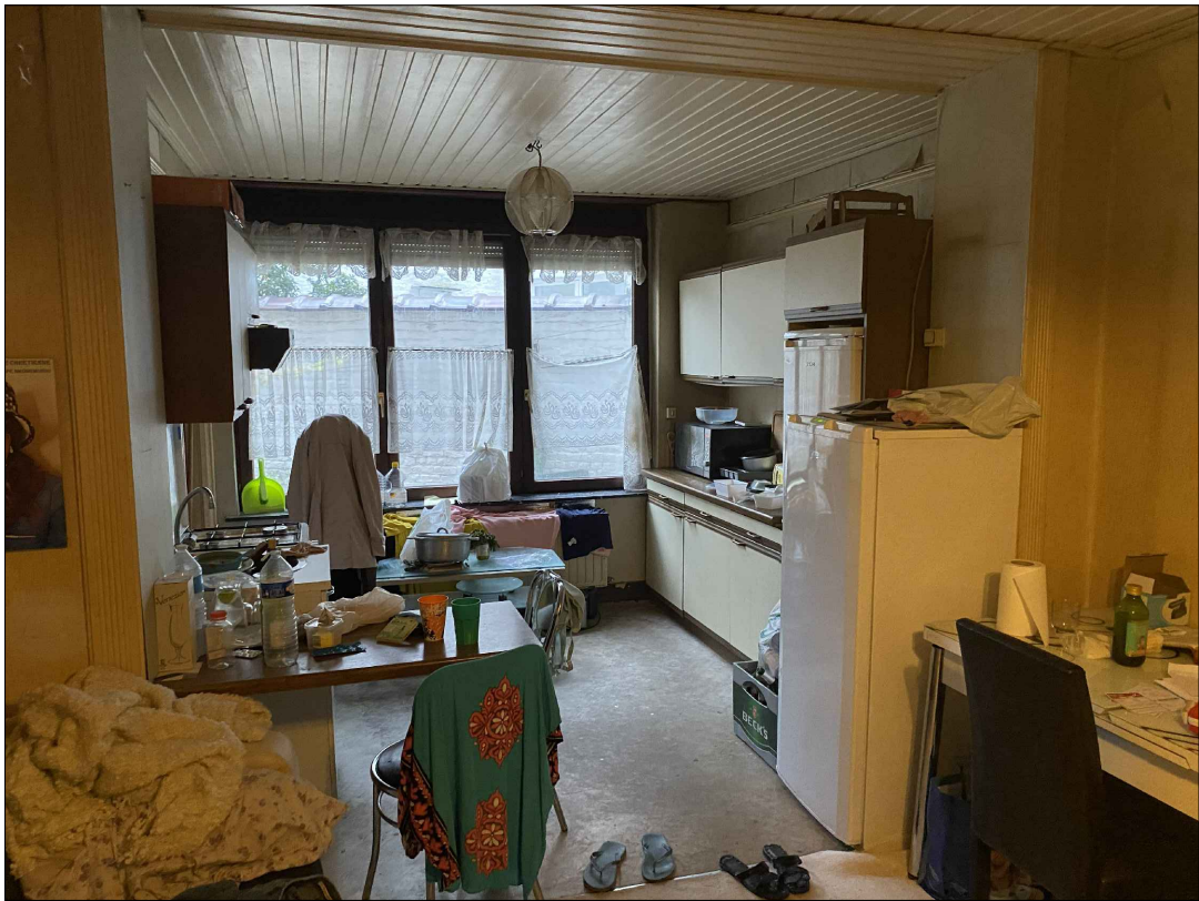
Photo Rez-de-chaussée Chambre vers façade avant